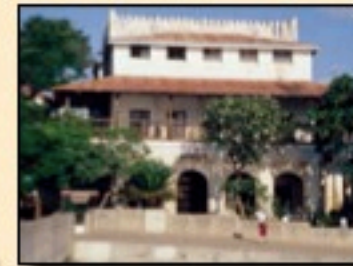
Musée de Lamu (Kenya)