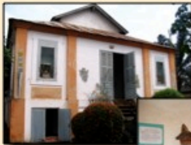
Musée ethnographique Alexandre Adandé (Bénin)