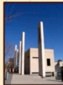
Musée de l'Apartheid (l'Afrique du Sud)