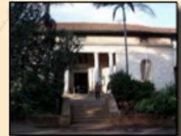
Musée national de Nairobi (Kenya)