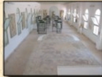
Le musée national de Carthage (Tunisie)