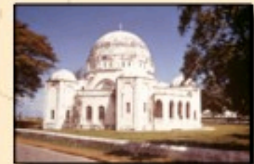
Musée de Zanzibar (Tanzanie)