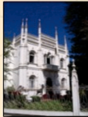
Natural History Museum, Maputo (Moçambique)